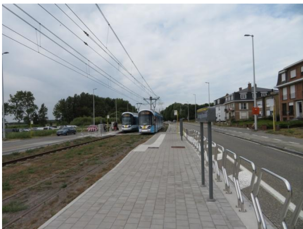
Nieuwe halte Strandwijk in Zeebrugge

Aan de Oostkust zijn er spoorvernieuwingen gebeurd tussen Blankenberge en Zeebrugge en in Wenduine. De haltes Zeebrugge Strandwijk en Vaart zijn volledig vernieuwd. De halte Strandwijk ligt wel wat teveel richting Blankenberge: de bewoners en de openbaarvervoergebruikers moeten naar het uiteinde van de wijk (Londenstraat) in plaats van in de omgeving St-Christianastraat, die veel centraler is gelegen.