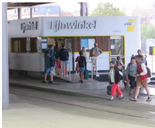
Lijnwinkel in het tramstation te Oostende