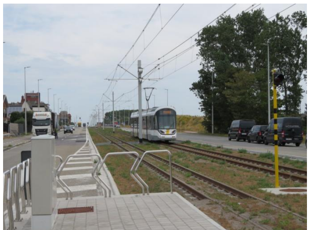
Zicht richting haven, de halte is opgeschoven!

Ook zijn deze nieuwe haltes niet volledig op hoogte gemaakt van de nieuwe CAF tramdeuren, maar er is enkel een verhoging voor één deur, zoals de meeste haltes aan de kust uitgerust zijn voor de middenbak van de oude BN trams. Is dit geen dubbel werk achteraf?