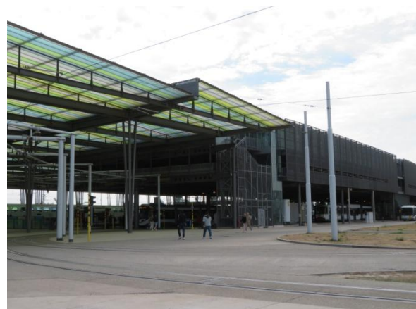
Het donkere tramstation en de "tijdelijke" Lijnwinkel

De glazen wanden naast het wandelpad van het treinstation naar de perrons van de trams worden niet onderhouden. Ik geloof dat deze nog nooit gekuist geweest zijn.