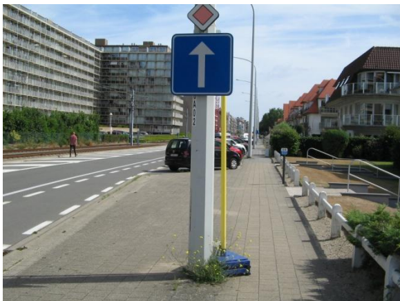
Verplaatste vervanghalte is wat weggestopt

Deze vervanghaltes zijn ook niet aangepast voor mensen die zich moeilijk kunnen verplaatsen of voor rolstoelen. In vele gevallen zijn het haltes waar je moet opstappen vanop straatniveau. Moet dit dan niet toegankelijk zijn voor iedereen?