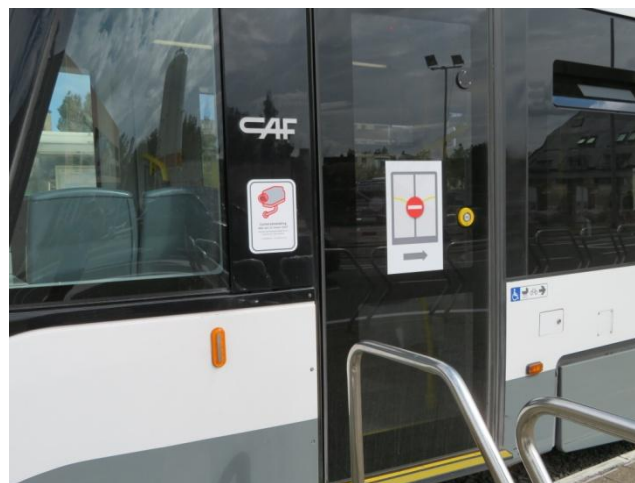
De aanduiding op de deur.

Hierbij aansluitend is het opgevallen dat de laatste deur van de CAF-trams gesloten blijft, omdat sommige perrons te kort zijn om toegang te geven (bijvoorbeeld Westende Bad richting De Panne). Kan men deze haltes niet snel aanpassen en de deur toegankelijk maken? Deze deur gesloten houden is natuurlijk een gemakkelijheidsoplossing.