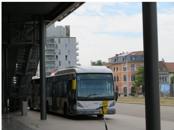
Vervangbus aan het station van Oostende

Zo aan het station van Oostende was het helemaal niet duidelijk dat er een vervangbus was en waar die te vinden was.