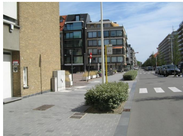
De vervanghalte op straatniveau!!