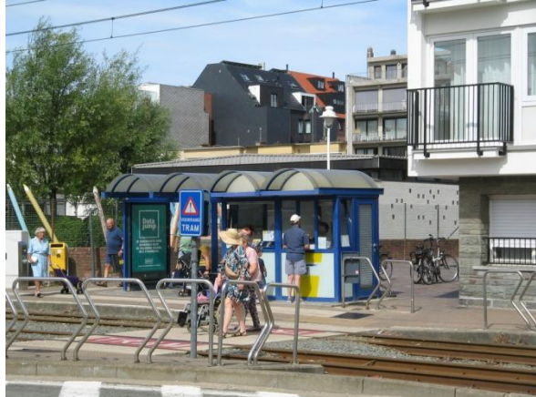
Lijnwinkel in Nieuwpoort Bad