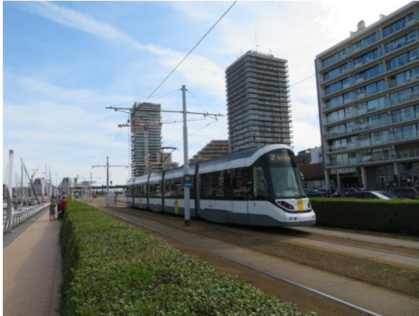
De CAF tram

De eerste opmerking is: waarom er nog altijd BN trams rijden? Zijn alle CAF trams nog niet geleverd of zijn ze nog niet allemaal beschikbaar voor de dienst?