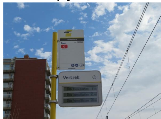
Een nieuw scherm