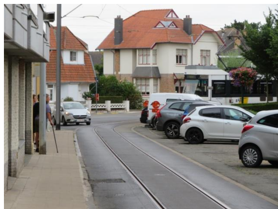
Vanaf 31 juni 2022 reden er terug trams tussen Oostende station en Westende station

Maar deze extra trams tussen Oostende station en Westende Bad zijn altijd al een zwak broertje geweest. Deze staan nergens aangekondigd op de dienstregeling, op de elektronische bordes of op de webstek. Reizigers die de situatie niet kennen weten niet wat deze tram doet. In het station van Oostende vertrekt die ook op het middenperron zonder duidelijke aankondiging.