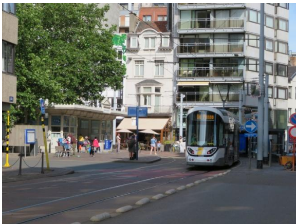
Lijnwinkel op Marie-Joséplein te Oostende

Er is nog steeds nood aan een bezoek aan de Lijnwinkel . Waarom zijn er zo weinig Lijnwinkels ter beschikking in het hoogseizoen en in het week-end? Is het niet nuttig om aan mogelijke reizigers, die misschien anders nooit de tram gebruiken, de juiste informatie te geven?